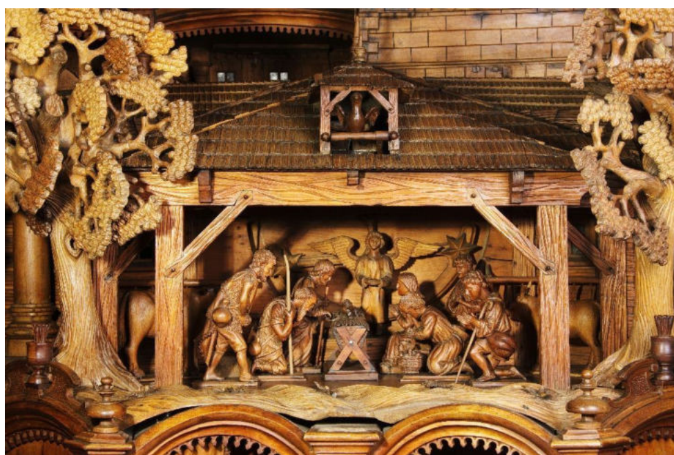
Třebechovický betlém—scéna Narození Páně

Krýzovy jesličky (Jindřichův Hradec) Mohelnický betlém Třebechovický betlém Rouhův betlém z Velešina