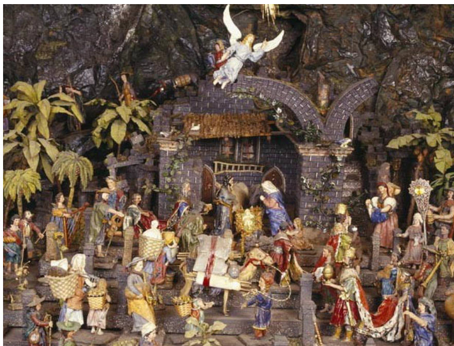
Krýzovy jesličky—ústřední scénérie

Do lidového prostředí se betlémy dostaly s reformami Josefa II. na konci 18. století. Josef II. nařídil uzavření některých církevních objektů a betlémy, do té doby stavěné v kostelích, odtud byly vykážány. Tehdy přišlo o zdroj obživy mnoho malířů a pozlačovačů, kteří dosud pracovali hlavně pro církve. Hledali tedy jiný způsob, jak se uživit a začali s betlémy.