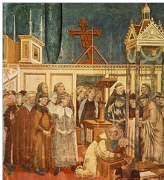
Giotto di Bondone: Sv. František připravuje jesličky v Grecciu

Podle tradice byla tato událost nejen prvním „betlémem“, ale byla tu prý poprvé sloužena i půlnoční mše.