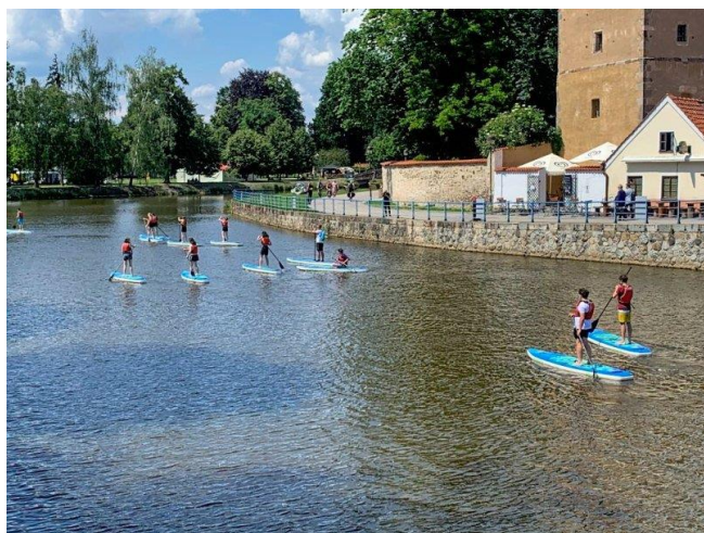
Tělesné výchovy netradičně