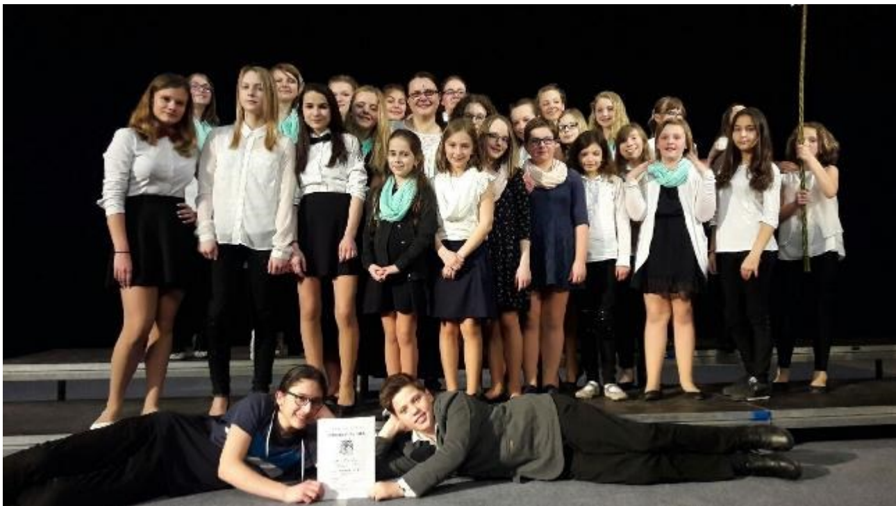
Stříbrný sbor měl velkou radost

Ve velkém sále se ale již chystal na soutěžní program sbor. Jejich vystoupení se jim až na nějaké drobnosti velmi povedlo a bylo oceněno stříbrnou stuhou na tradiční pomlázce. Orchester měl ještě několik chviliek času a to se mu v soustředění na výkon stalo trochu osudným. Na podium naladil tak, že trochu nedoladil, a celé vystoupení byl nepochopitelně nervózní. Přesto nezklamal a i porota jejich vystoupení ocenila bronzovou stuhou.